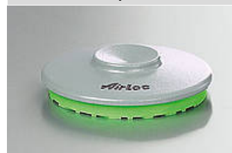
Ilustración del tipo

Para este elemento de nivelación se usa el perno roscado del cliente.