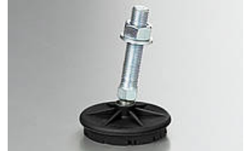
Ilustración del artículo