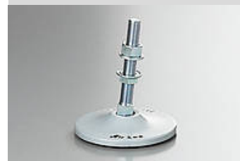
Ilustración del artículo