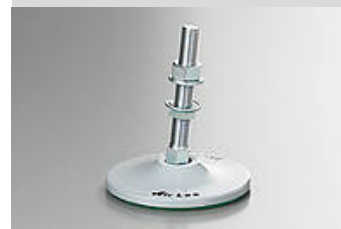
Ilustración del tipo