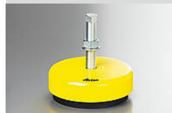
Ilustración del tipo