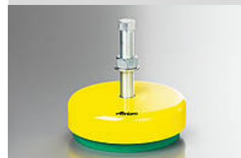
Ilustración del artículo