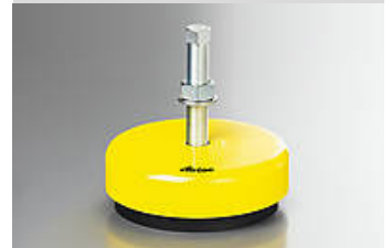
Ilustración del tipo