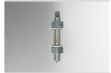
Ilustración del tipo