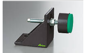
Ilustración del artículo