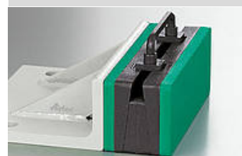
Illustration de l'article