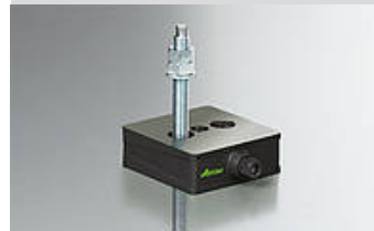
Illustration du type

Remarque étendue de livraison Tiges filetées sont à commander séparément.