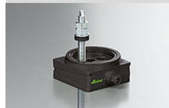
Illustration du type

Remarque étendue de livraison Tiges filetées sont à commander séparément.