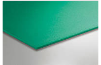
Illustration de l'article