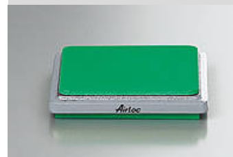
Illustrazione del tipo