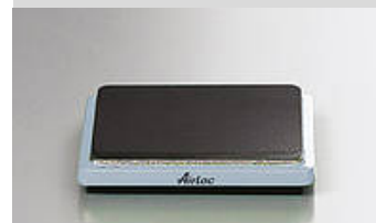
Illustrazione del tipo