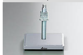
Illustrazione del tipo