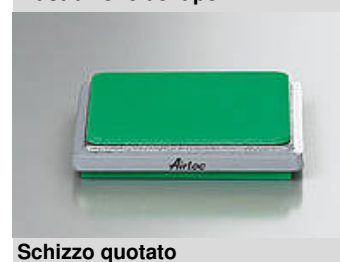
Illustrazione del tipo