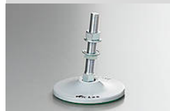
Illustrazione del tipo