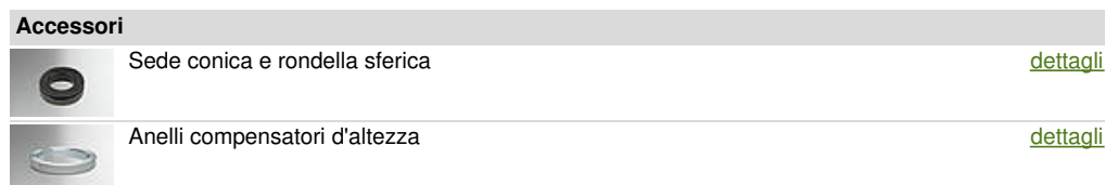
Illustrazione del tipo

Commenti utili Accessori: Anelli compensatori d'altezza tipo 113V-6/12