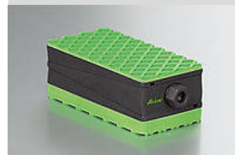
Illustrazione del tipo