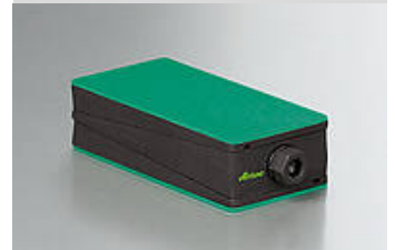
Illustrazione del tipo