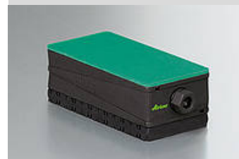
Illustrazione del tipo