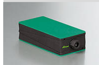
Illustrazione del tipo