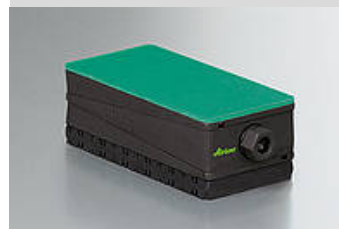
Illustrazione del tipo