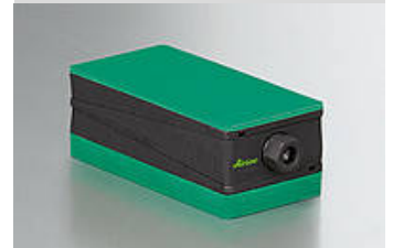
Illustrazione del tipo